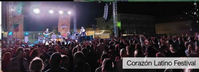
Corazón Latino Festival