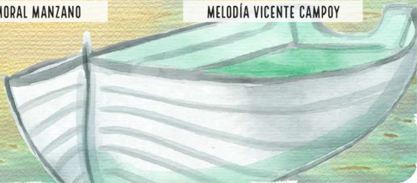
MELODÍA VICENTE CAMPOY