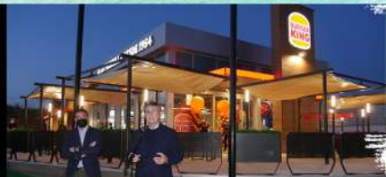
Inauguración Burger King en Adra