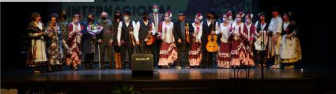
Gala de la Mujer