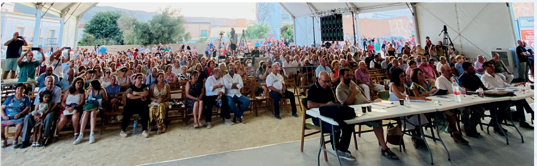
Carpa del Festival