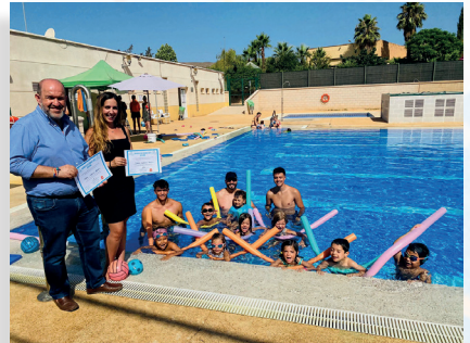
Cursos en la piscina municipal