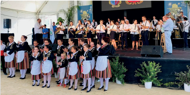
Banda de música y La Garita infantil en Festival de la Alpujarra