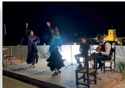
Festival Flamenco Tallo de la Higuera – Celín