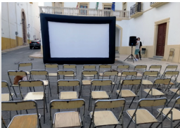
Cine de Verano