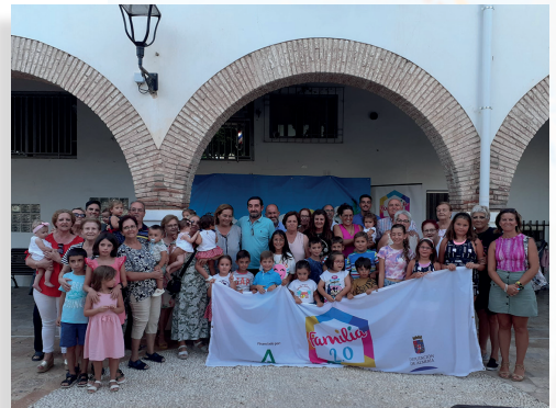
Homenaje a los abuelos y abuelas