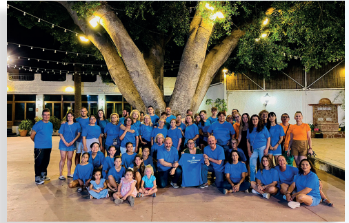
Voluntarios del Festival

En estos meses hemos vivido una intensa agenda de actividades que hemos compartido tanto en Dalías como en Celín. De ellas en esta página dejamos una muestra de algunas, destacando la celebración del 39º Festival de Música Tradicional de la Alpujarra, pero el verano también ha sido cine, actividades en la piscina, talleres y música, mucha música con la peña Flamenca la Victoria, la Peña Culo Verde y la Asociación de Vecinos de Celín, o el rock&roll en el aniversario de la peña motera Los Palomos. ¡Gracias a todos!